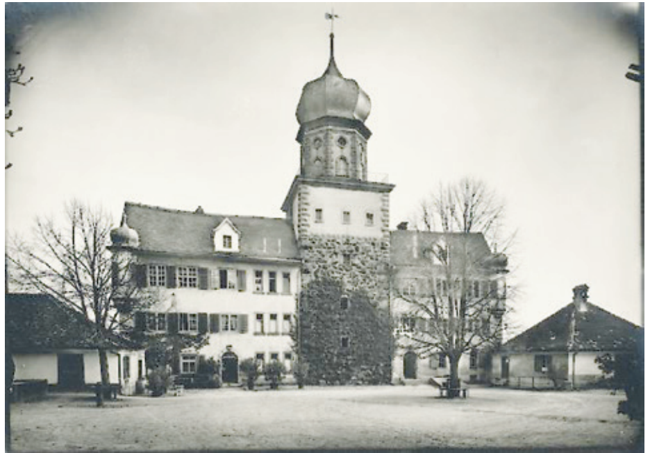
Schloss Herdern ist ein Ort für Menschen, die ihren Platz in der Gesellschaft verloren haben. (Historische Aufnahme um das Jahr 1930).

Im Rahmen der Jubiläumsfeierlichkeiten findet am Samstag, 27. Juni 2020 ein Tag der offenen Tür statt, an dem sich Interes-