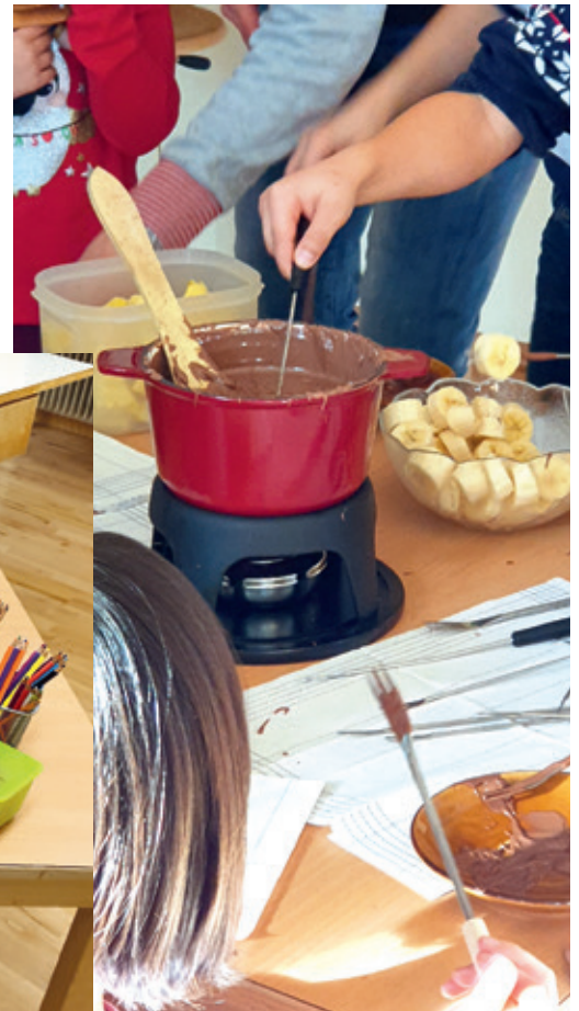
Nach dem Ausmalen von Madalas macht das Schoggi-Fondue Allen Spass.