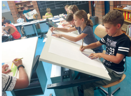
Schüler im Schulzimmer.

In Herdern starteten neu alle Primarschulklassen mit total 81 Kindern. Sie werden von 11 Lehrpersonen, inkl. schulischer Heilpädagogin und Logopädin, unterrichtet. In zwei Klassen arbeitet je eine Assistenz zur Unterstützung von einzelnen Kindern. Schon in den ersten Wochen zeigten sich Erleiche-