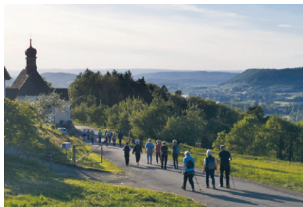
Gemeinsam unterwegs nach Klingenzell Anfang Mai.

Die Wallfahrt nach Klingenzell stand un-