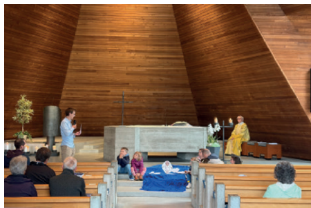
Klein und Gross feierten Auffahrt in der Kirche St. Franziskus.

Christi Himmelfahrt haben wir auch dieses Jahr mit zwei Gottesdiensten gefeiert. Die